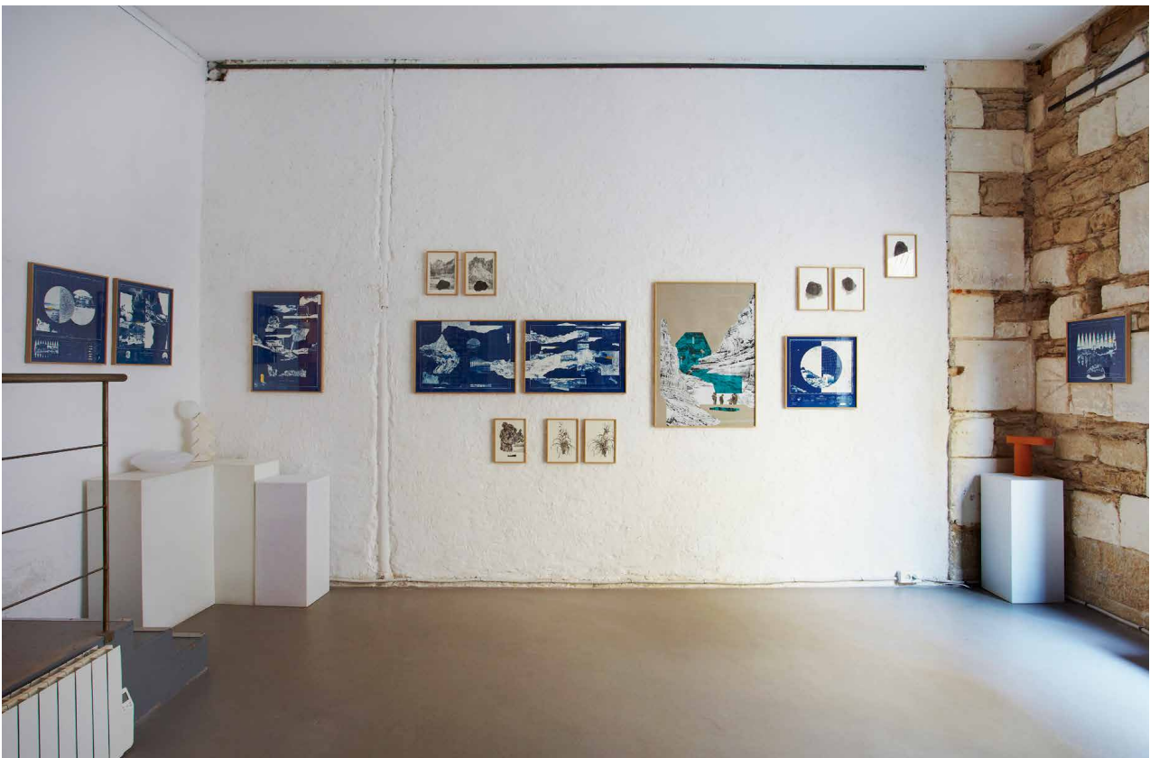
Jérôme MAILLET & Macula Nigra VUES DE L'EXPOSITION RÉSERVE_2021 à l'espace MIRA VIEW OF THE RESERVE EXHIBITION_2021 at the MIRA space